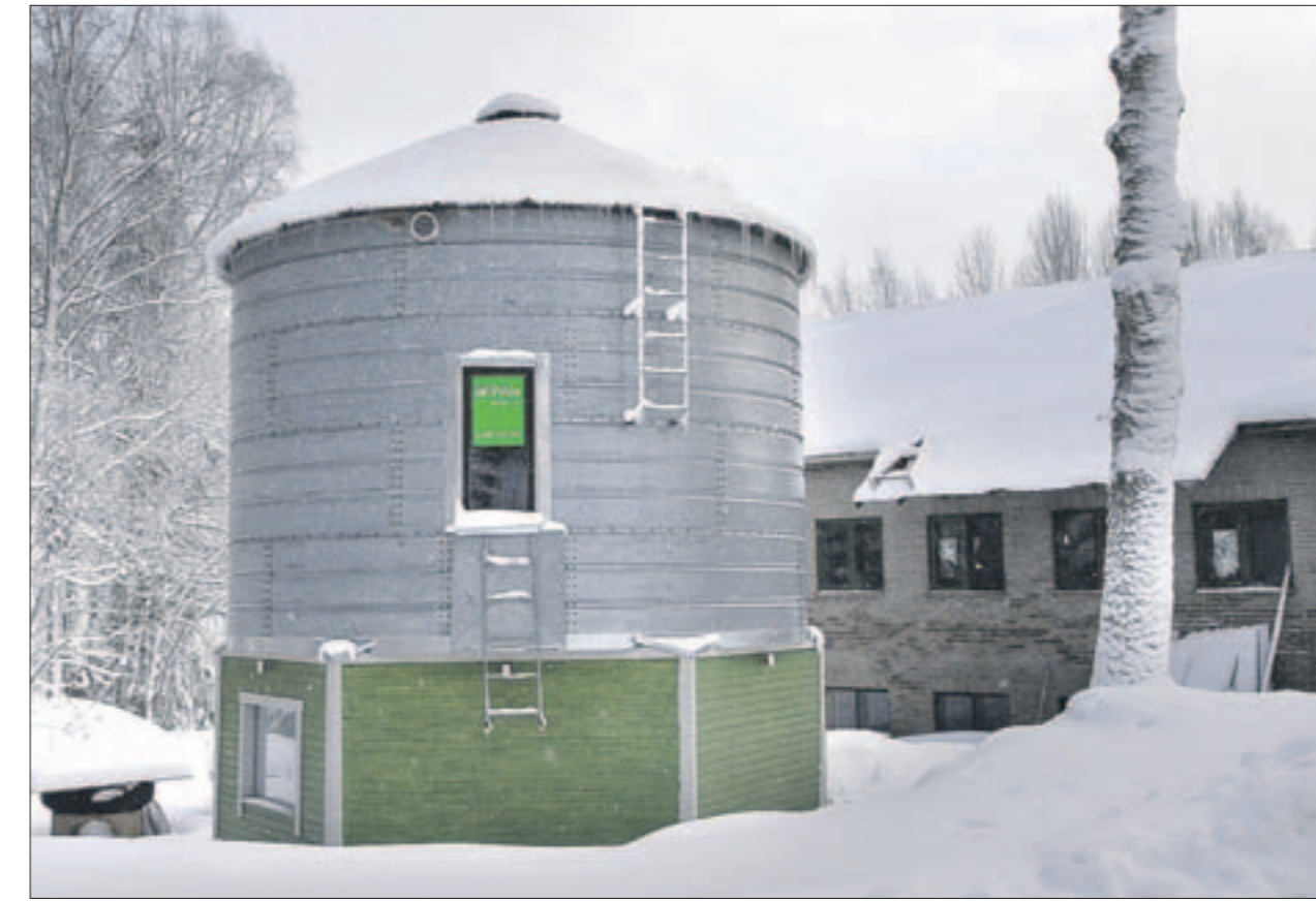
Rakennuksen pyöreä muoto näkyy hienosti löylyhuoneessakin.